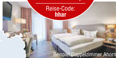
Beispiel Doppelzimmer Ahorn